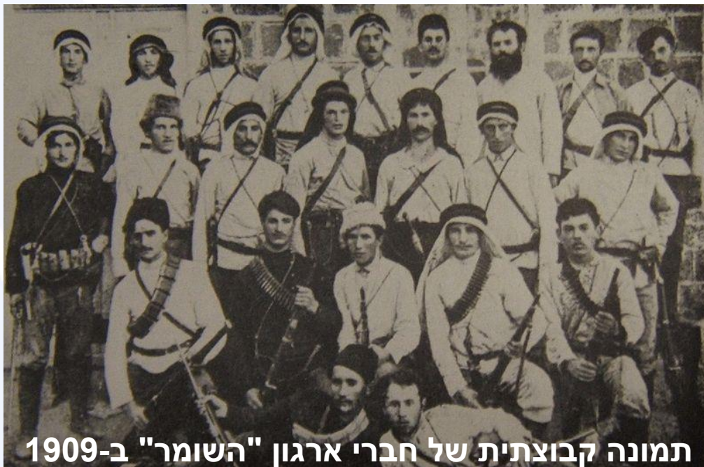
תמונה קבוצתית של חברי ארגון "השומר" ב-1909